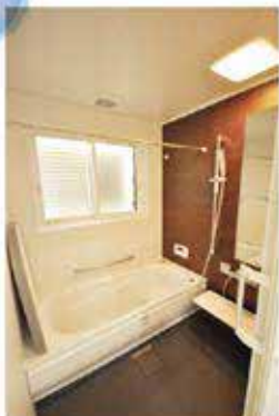
お掃除ラクラク人大浴槽を採用