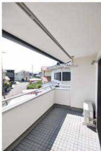
バルコニーは、屋根を全体にかけることで、 雨が降ってきても洗濯物がぬれません