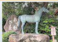
一の鳥居伝のブロンズの馬