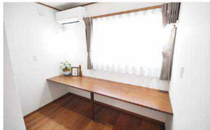
2階に設置したファミリースペース 色々な用途で利用できるカウンター