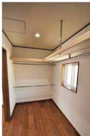
寝室には、4帖のウォークインクローゼットを 作り沢山収納できます