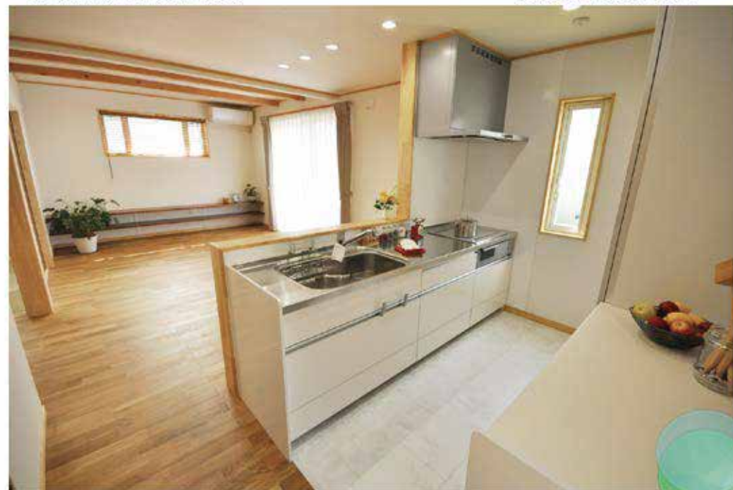
キッチンの床は、頑固な汚れに強い材質なのでお手入れも簡単にできます