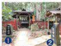
①姫宮神社、②別雷神社