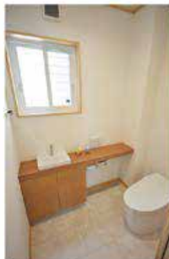
1・2階共にタンクレスなので床のお掃除が簡単です