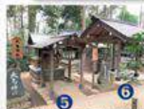
⑤大島神社、⑥恵比寿神社