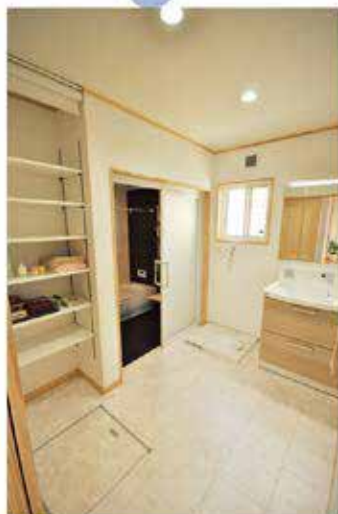
洗面室にも、収納棚があるので 家族で広々と脱衣室が使用できます