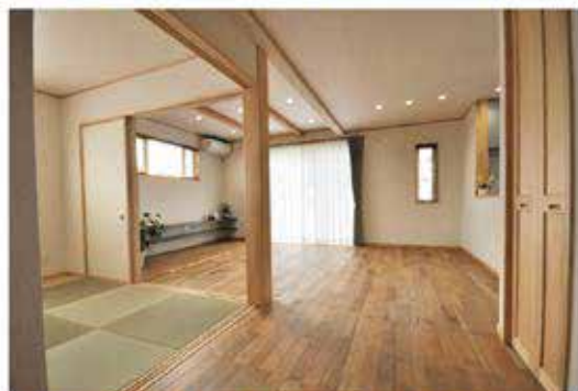
正面にある大黒柱は、桧6寸を使用しました