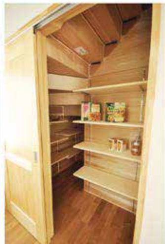
キッチン横には階段下を利用した食品庫