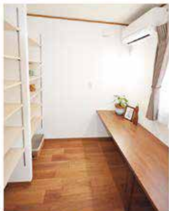
みんなで本を読んだり 楽しめる空間ができました