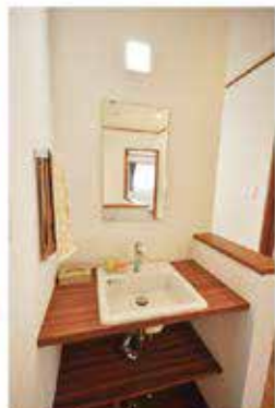
手洗いカウンターで すっきり美しさを保ちます