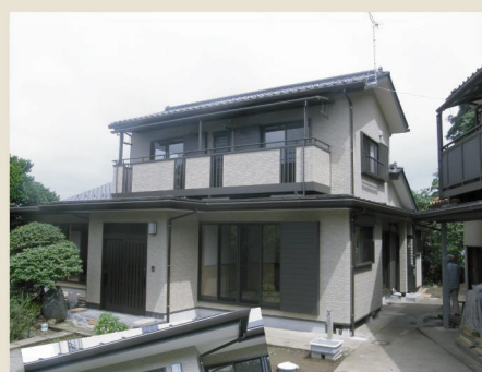
after: 外観 屋根・外壁ともに新しく 生まれ変わりました・・・