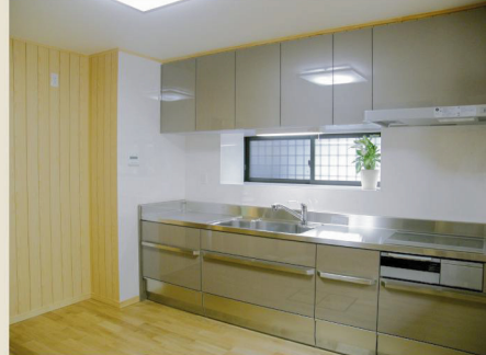
奥様がこだわったS.Sのキッチンです・・・