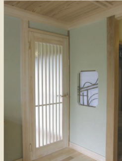
玄関：和室の小窓。こちらも既存のもの。