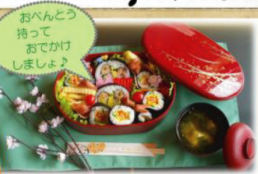
飾り巻きずし*バラの花*