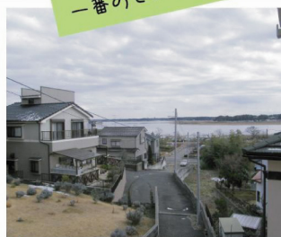
四季折々の手賀沼を一望できます

手賀沼が見える自然豊かな土地に家を建てることを決めていたので、採光と眺望を優先しました。木の風合いを十分に生かした設計にとても満足しています。