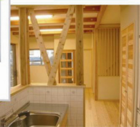
キッチンから リビングを見渡せます

家に帰ると木の匂いが最高です！ 床は杉の無垢材なので、 直接寝ころんでも気持ちよく、 スリッパを履かずに居られます。 室内はとても温かく、心地よいです。