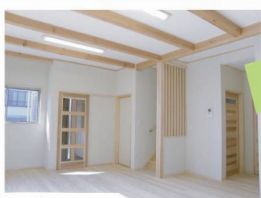
光あふれるリビングで ついごろんとしたくなります