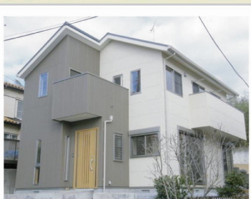
天然素材にこだわった家が完成しました！

結婚してからアパート暮らしでしたが、戸建住宅を希望する妻と一緒に住宅展示場に入ったのが家づくりのきっかけでした。木の国工房の和木あいの家に入った瞬間、たまたま木の香り、木に囲まれた室内の第一印象が他のメーカーとは違ってもよかったです。国産材や山の話、通気工法、薬剤を使用しないなど、住む人の健康に関わる説明を聞いて十分に納得できました。何よりも子どもたちの成長のためによいと思ったのが一番の決め手です。