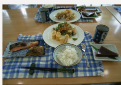
季節のかき揚げ・だし巻き卵 焼き鮭、焼きナス、水羊かん