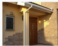
玄関タイル・鋳物の面格子