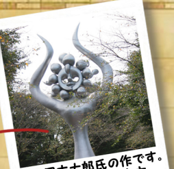
あの岡本太郎氏の作です。船橋市の平和都市宣言記念シンボル像です。