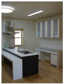
フラットキッチン