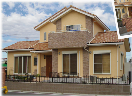
コーナー等にタイルを貼り重厚感のあるデザインに！！