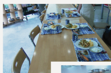
皆さんと、 食事を しました。