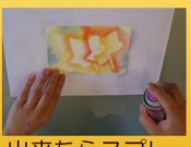
出来たらスプレー