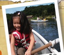
太陽の池でボート乗り。この時期はとても気持ちがいいですよ。

今回はちょっと趣向をかえて町並み紹介ではなく、「芸術の秋」をおもいきり楽しめる「ふなばしアンデルセン公園」にスポットをあててご紹介します。