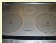
お料理後の黒ずみ。

IHクッキングヒーターは、コンロと違いゴトクがないので使った後サッと拭くだけでOKです。しかし、フキンでふくだけでは、どうしても黒ずみ、焼け焦げがとれませんよね。近頃は、IHクッキングヒーター専用のクリーナーもありますが、身近なもので簡単に掃除ができます。