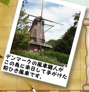
デンマークの風車職人がこの日に来日して手がけた粉ひき風車です。

船橋市とデンマーク・オーデンセ市は姉妹都市としてむすばれており、アンデルセン像の複製化はデンマーク国内外で初めて船橋市が許可されたそうです。