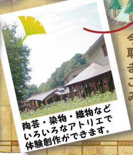
陶芸・染物・織物などいろいろなアトリエで体験創作ができます。

船橋市とデンマーク・オーデンセ市は姉妹都市としてむすばれており、アンデルセン像の複製化はデンマーク国内外で初めて船橋市が許可されたそうです。