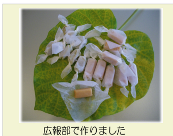
広報部で作りました