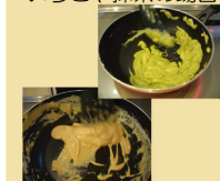
いちご抹茶の場合