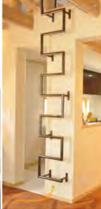
ハイセンスな「一筆ハシゴ」