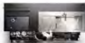
CENTER POSITION センターポジション設計

クリナップがつくり手として目指したのは、機能にも美しいフォルムにも、一切の妥協を許さず、究極の機能を突き詰めた技術の結晶。ぜひ、商品をご覧ください。