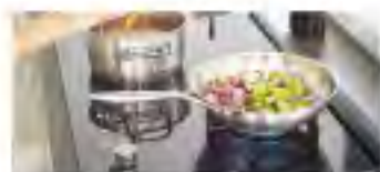
DUAL CHEF デイアルシェフ～ハイブリットコンロ～

1段上がったシンクはプレートを使えばシンク上まで作業スペースに。1段下ったデッキ部は直接水を流せません。クラフツマンたちの手仕事が光ります。