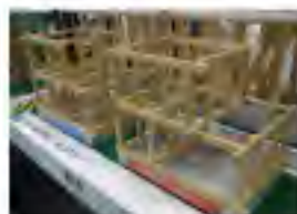
模型を多用した耐震性の実験コーナー

「耐震」「省エネ」「健康」「木材活用」「IT」に対応した新商品がたくさん展示されていました。耐震・制震部材の展示や震度7の地震が体験できるコーナーやAI技術が住まいや暮らしにもたらす新たなステージを体験できるコーナーもありました。また、同時開催されていた「木と住まいの大博覧会」では、木の椅子をつくったり、木を使ったおもちゃがあったりと木に触れ合える展示会もありました。こちらは木のいい香りがして、また違った面白さがありました。