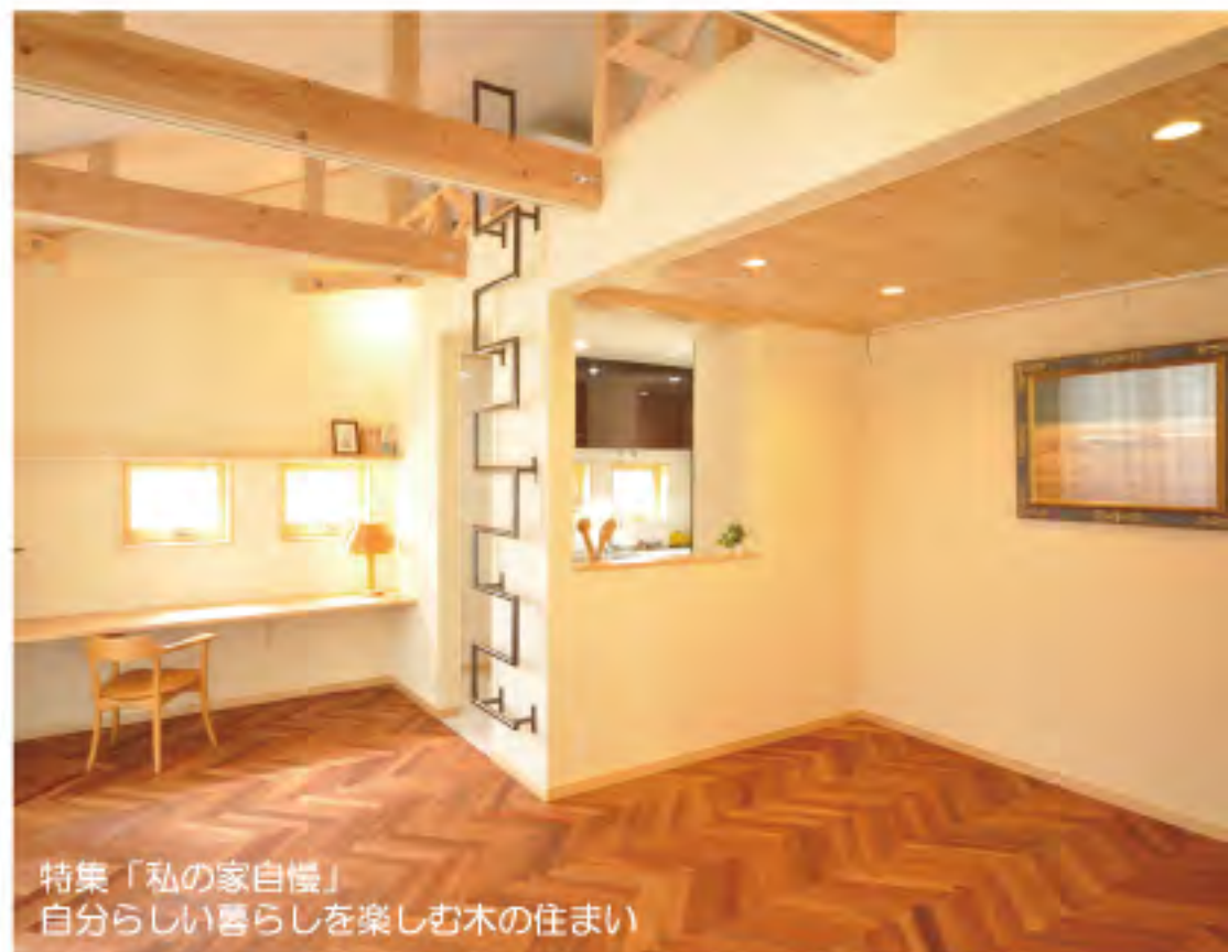
特集「私の家自慢」 自分らしい暮らしを楽しむ木の住まい