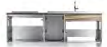
STAINLESS CABINET ステンレスキャビネット

ワークトップと同じ素材のカウンターが配置によってキッチン前カウンターやテーブルなどに自在に変化。お料理づくりや食事の楽しみ方を拓けます。