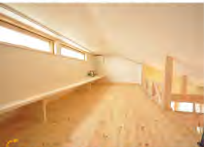
思わず寝転びたくなるパイン無垢床のロフト

2階リビングは勾配天井を活かして ロフトを設けました。リビングと繋がっているの で家族の気配を感じながら読書や趣味、お昼寝など 一人の時間を過ごせる至福の空間です。 また、ロフトには窓を設けたので、 明るく風通しが良く、夏場は涼しく、 冬場は暖房なしでも過ごす事ができるそうです。