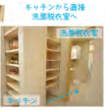
キッチンから直接 洗面脱衣室へ