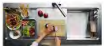
CRAFTSMAN DECKSINK クラフツマンデッキシンク

清潔感のある「ステンレス」、種類豊富な人工大理石「アクリストーン」、陶器のように味わい深い「セラミック」から選択いただけるようになりました。