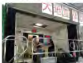
地震車による地震体験コーナー