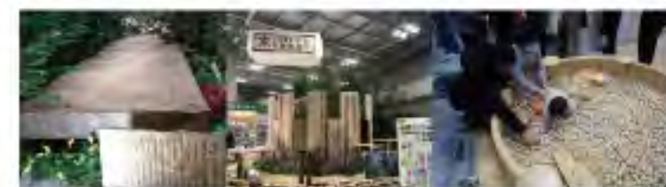
神代杉という縄文時代の杉も展示されていました。