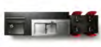
LINK COUNTER リンクカウンター

ガスコンロとIHの両方を搭載した調理機器。料理に合わせて熱源を選べます。煎焼の専用プレートを使用すれば、コンロ上でグリル料理が可能です。