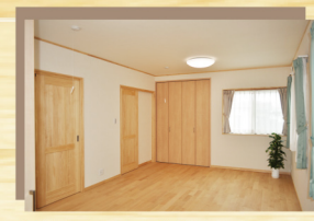
2階の12帖のお部屋は 将来6帖2間に仕切れることもできます。

家造りでこだわった点を教えてください。 いつも木の温もりが感じられるように、1階・2階の全ての床を無垢のカバザクラにしました。 また、家のどこにいてもお互いを感じられるように、1階・2階とも回遊性のある間取りにしました。