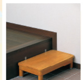
上がり框の段差を小さくする式台

*工期:1日 *工事費用 2,800円～ (材共) 定尺タイプ (長さ760mm) 設置場所に応じた 高さが選べます。