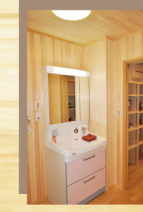
桧の香り漂う洗面脱衣所！