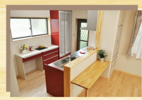
赤いキッチンが印象的です！

木の国工房を選択した理由をお聞かせください。 つくば展示場のモデルハウスや建築中の現場に入った瞬間木の香りが満ちているのに心を動かされました。 また、営業の方がとても信頼できたこと、現場見学の際に基礎の造りや断熱等の施工が丁寧だったことが決め手でした。