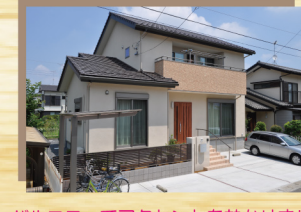
バルコニーでアクセントを効かせました！

その他、感想などをご自由にお聞かせください。 疑問・不安に思ったときの対応がとても早く安心しました。大工さんには丁寧かつ正確な仕事をして頂き大変感謝しております。 木の国工房さんの真面目な家造りにとても満足しております。