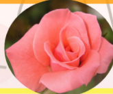
プリンセス アイコ

アンネの日記で有名な、 アンネ・フランクの名前が 付けられたバラです。 日本では「アンネのバラ」 として有名です。