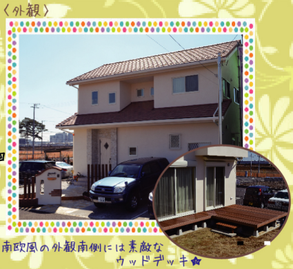
南欧風の外観南側には素敵なウッドデッキ☆

休日の過ごし方 以前は外出することが多かったのですが、リビングでくつろぐ時間が多くなりました。広いリビングのおかげで趣味であるテニスの素振りが出来たり、妻習でフルートを練習したり、娘もできるよーい、ドン！と言いながら、とてもしょうに走り回っています。そんな様子を見ると、家を建てて良かったと思います。