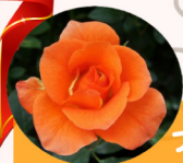
プリンセス ミチコ

バラには、世界の有名人の名前が つけられたものがたくさんあります。なかでも、 日本の皇室・世界の王室・世界の有名人の名前を 冠したバラを一部ご紹介します。