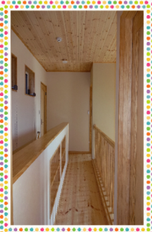
廊下には壁厚も利用して本棚を造りました