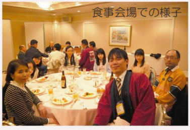
食事会場での様子