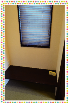
畳敷きの落ち着いた書斎