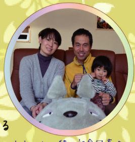
トトロと一緒に記念写真♪

木の国工房を選んだ動機 木材・構造への強いこだわりが選んだ動機です！また、疑問点に丁寧に答えてくれる姿勢や、理想としていた広々とした空間を造りだせる提案力に惹かれました。