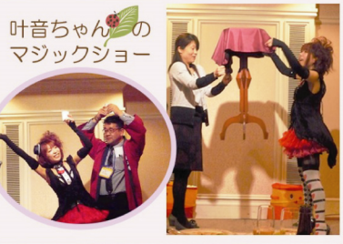
叶音ちゃんのマジックショー