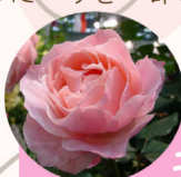
クイーン エリザベス

1966年に英ディクソン社 から、皇太子妃時代の 美智子妃殿下に捧げら れたバラです。