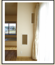
ワンちゃんスペースには壁をくり抜きました