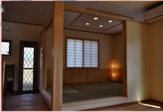
旦那様お気に入りの和室。のんびり～