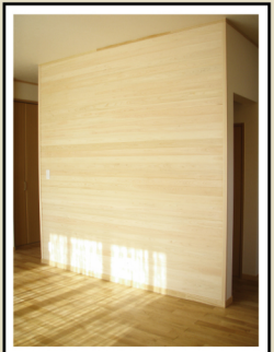
桧の板張りが無垢感を演出