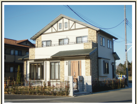
細部にまでこだわったセンスの光る外観

無垢床の心地良さ、夏の暑さや冬の寒さがほとんど気にならなかったのもとても快適に毎日過ごしています。練りに練った間取りも実際に住んでみて使い勝手がとても良いので気に入っています。