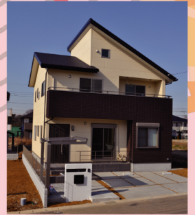
国産材100%で建てた 上質感あふれる家