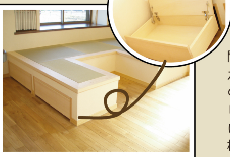
ダイニングの畳コーナーは収納にもなっています

● 家造りでこだわった点は？ 外観のデザイン、家相、リビングに畳スペースを造ること、書斎スペース、人が大勢集まる家…etc家造りに関して全てにこだわり、出来るだけ無垢材も使用しました。予算内で希望をすべて取り入れることができ満足しています。