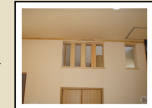
開口部を設け階段ホールとキッチンにつながるようにしました