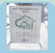
お客様1邸ごとに認定証を贈呈致します

CO2を固定化する国産材の家。その家がそこに在り続ける限り地球環境に貢献し続けます。