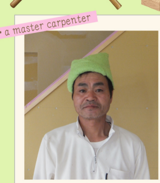
・ a master carpenter