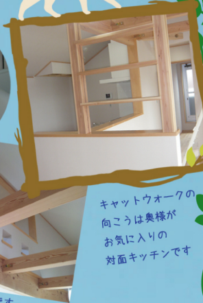
キャットウォークの向こうは奥様がお気に入りの対面キッチンです