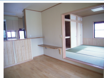
ダイニングから続く和室は、ご夫妻の空間です。