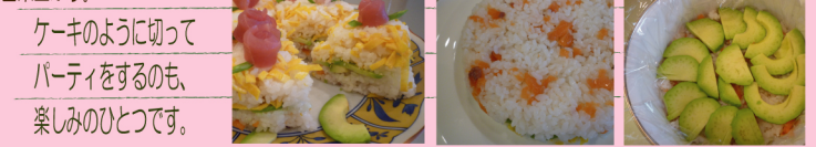
ケーキのように切ってパーティをするのも、楽しみのひとつです。

【作り方】1. 白用と緑用の牛乳を別々の鍋で沸騰直前まで温めます。それぞれにふやかした粉ゼラチンと砂糖を加えて混ぜます。緑用の鍋には、更に混ぜ合わせたBを加えて混ぜます。2. 赤用のゼラチンは、ふやかした容器のまま、湯せんにかけて溶かします。混ぜ合わせたCとゼラチンを混ぜます。3. 3色のゼラチン液を別々の容器に入れ、冷蔵庫で固めます。容器から取出し、白、緑、赤の順に重ねてひし形に切り、器に盛り付けて出来上がり。