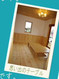
思い出のテーブル