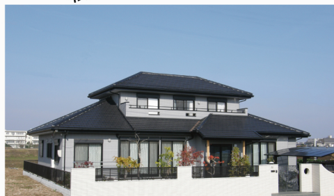
あきのこない外観。全体に下屋をまわし日本の風土にあった家造りの形です。