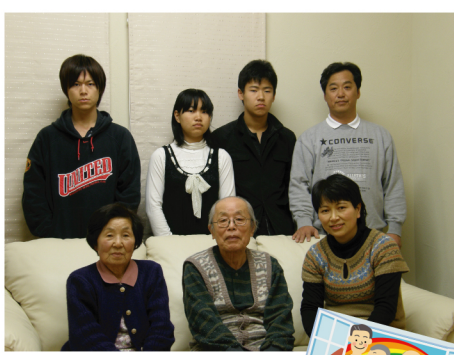
3世代が住む素敵なファミリー