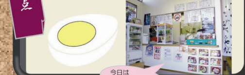
今日は 回食べようかな